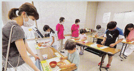
わんぱくランドで 楽しい紙芝居とまめつかみ