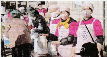
食文化継承… どんど焼餅玉作りがんばるぞ！