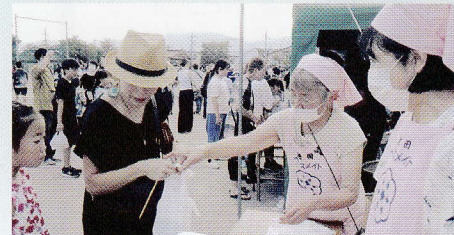
ふるさと祭り！ おにぎり作りと減塩推進PR

機会としていただくために、地区 などを行いながら、朝ごはんの推進、 )や食育の日(毎月19日)の啓発、 等に取り組んでいます。