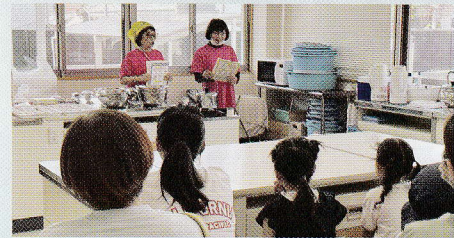
今後も朝食摂取 よく噛む等推進していきます