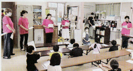
また来てねの一言が嬉しく 次に繋がります