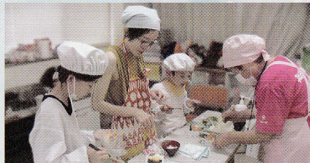
親子料理教室で 「おにぎらず」を作りました