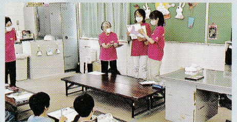
放課後児童クラブで 食育活動をしました