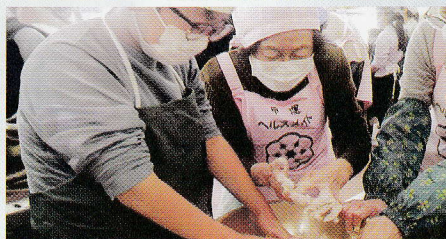
皆で粉をこねて伸ばすのを 楽しんでやりました