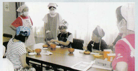
ほうとう作り たのしい豆つかみもしました