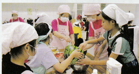
子供達と一緒に ほうとう作りをしました