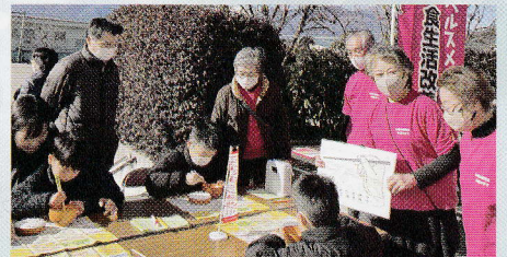
「新年親子の集い」で 正しい箸の持ち方を継承！