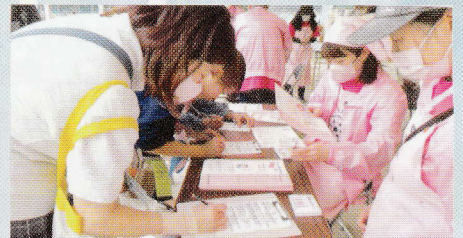
おいしく食べて 健康に皆で楽しく活動します