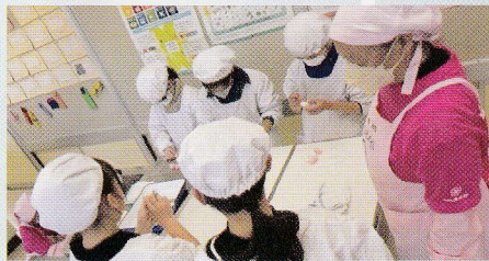
地域と育む小正月行事 「まゆ玉づくり」