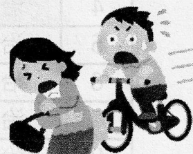
歩行中に車両と衝突