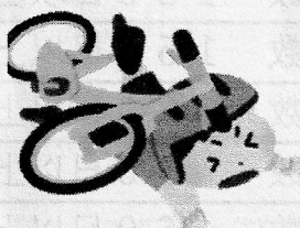
自転車・バイク での転倒