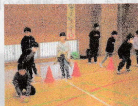
①キャッチ&スロー大作戦!!

この日を成功させるために力を尽くした子ども達、頑張りを支えてくださった保護者の皆様、一緒に盛り上げてくださったPTA役員の皆様、子ども達の頑張りを参観してくださった学校運営協議会の皆様に、心より感謝申し上げます。