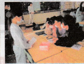
⑪アナタの感覚を試せ!! 長さあてゲーム