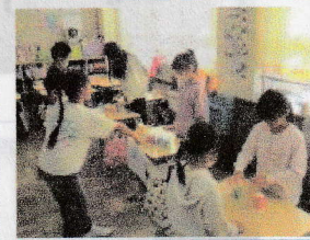
⑧中身の数を当てよ! ボックス☆タイム