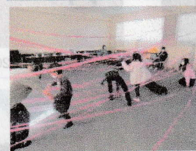
⑦スパイダールームから 脱出せよ!