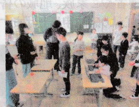
②出た数字で止める!! ビッタイマー