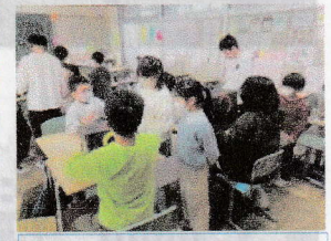
⑥30秒で当てろ! ミステリーボックス