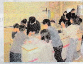
⑤ニコちゃんマークを探せ!