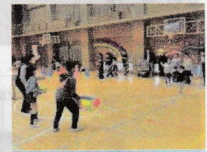
⑨当てられなきゃ帰れ10!