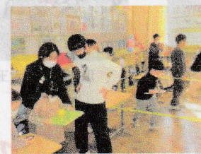
⑩お前もバランスを取らないか!?