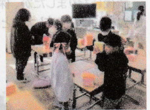
③当たりを見つけろ!