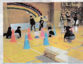
④障害物をよける だるまさんが転んだ!!