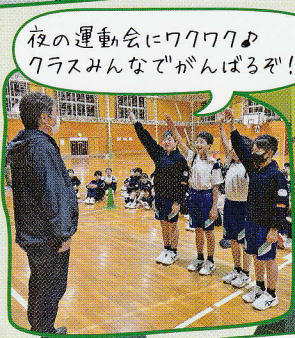
夜の運動会にワクワク♪ クラスみんなでがんばるぞ!!