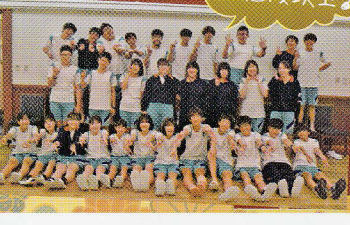
楽しい思い出 お値段以上の