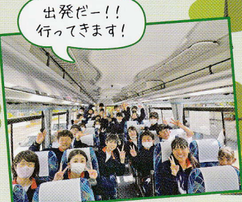
出発だー!! 行ってきます!