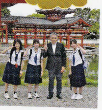
校長先生 ありがとう