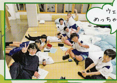
ウエ〜イ!!! めっちゃたのし〜!!