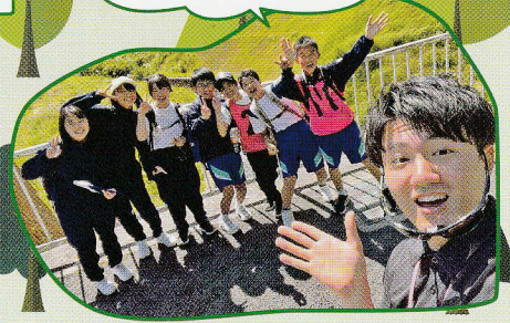
大変だけど楽しかったあ