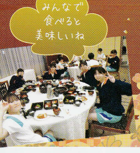
みんなで 食べると 美味しいね