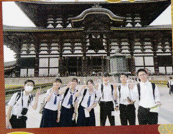
東大寺で ハイチーズ!