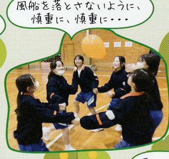
風船を落とさないように、 慎重に、慎重に...