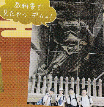
教科書で 見たやつ デカッ!